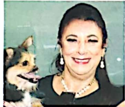
Mara protetora dos animais